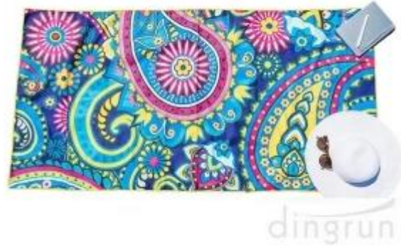
Exporteur von Strandtüchern aus Mikrofaser