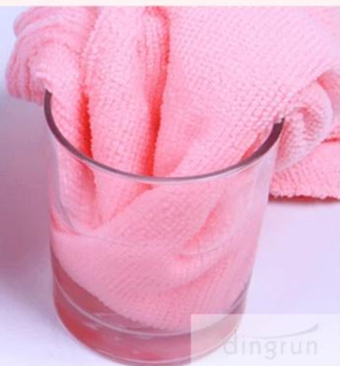
Left 1/3 glass of water