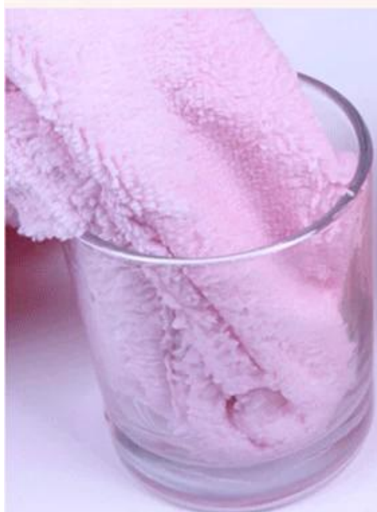
Almost left no water