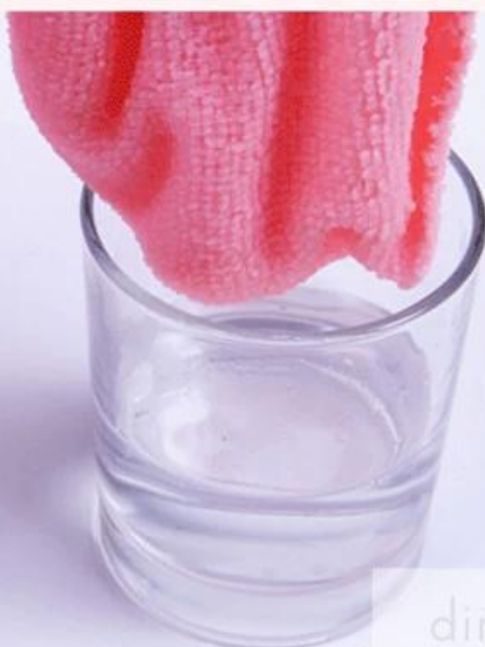
Relatively weak absorption