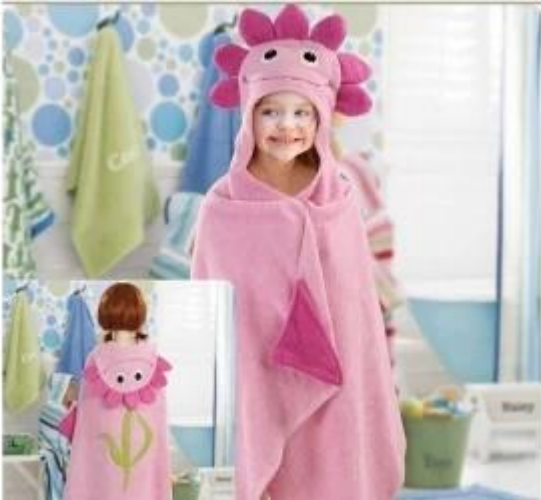
Hersteller von Strandtüchern mit Kapuze für Kinder