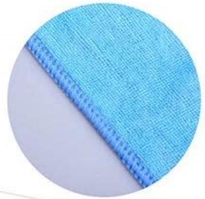
High Quality stitching