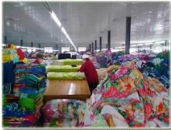
品检 product inspection