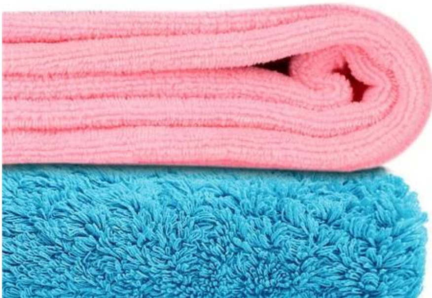
OUR PREMIUM TOWELS