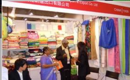
June 19-21, 2012 Miami Houseware Fair, USA