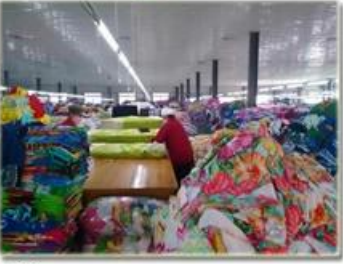
品检 product inspection