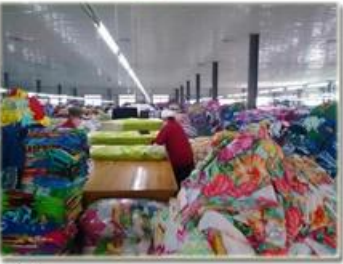
品检 product inspection