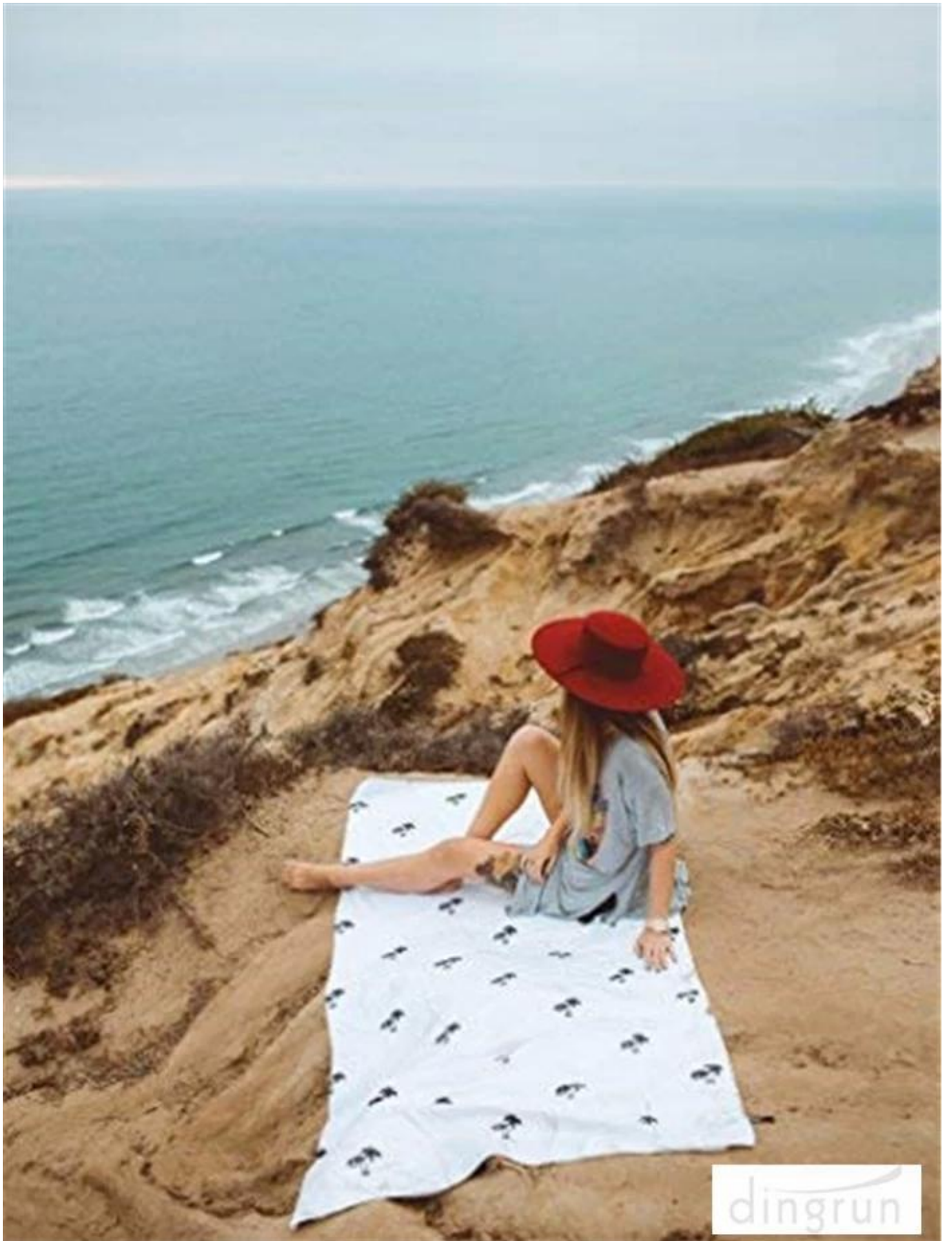
FREUNDLICH FÜR / ALS: Strandreisen, Strandtuch, Stranddecke, Badetücher, Picknickdecke, Camping