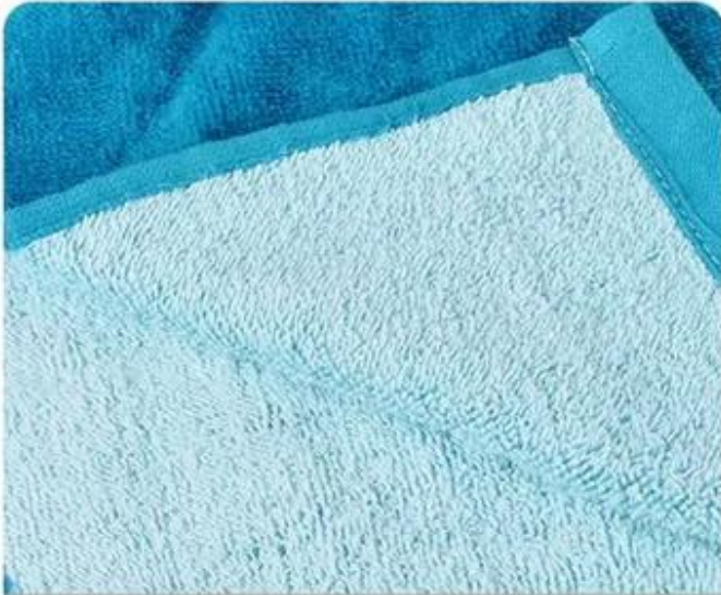
Fabric Cotton Breathable and comfortable