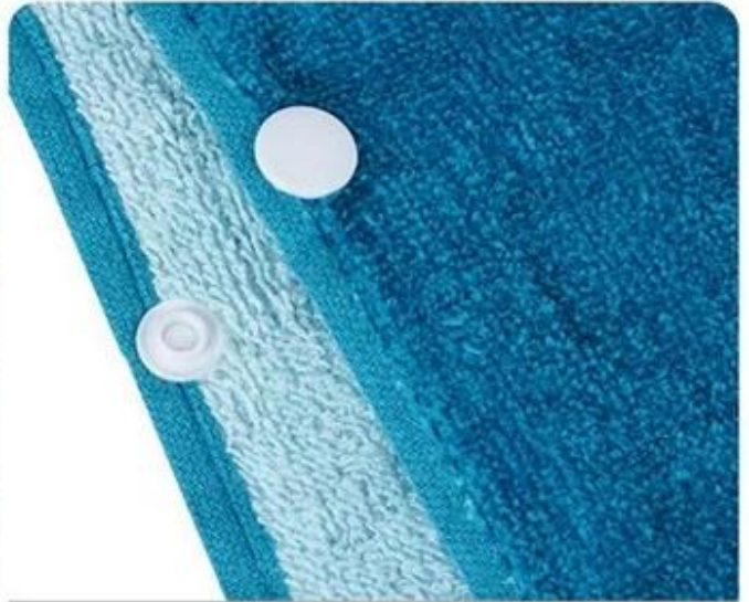
Button Design Prevent towel fall off