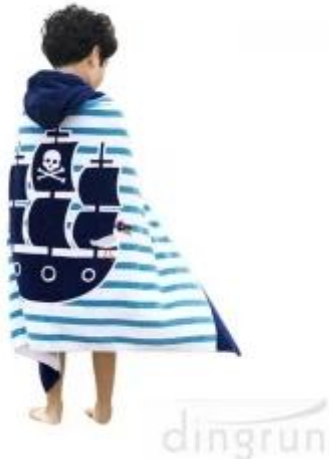
Toalla poncho con capucha