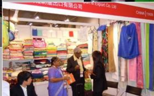
June19-21, 2012 Miami Houseware Fair,USA