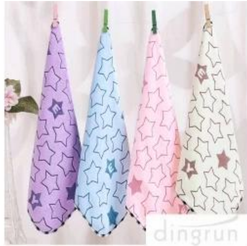
Toalla de cara