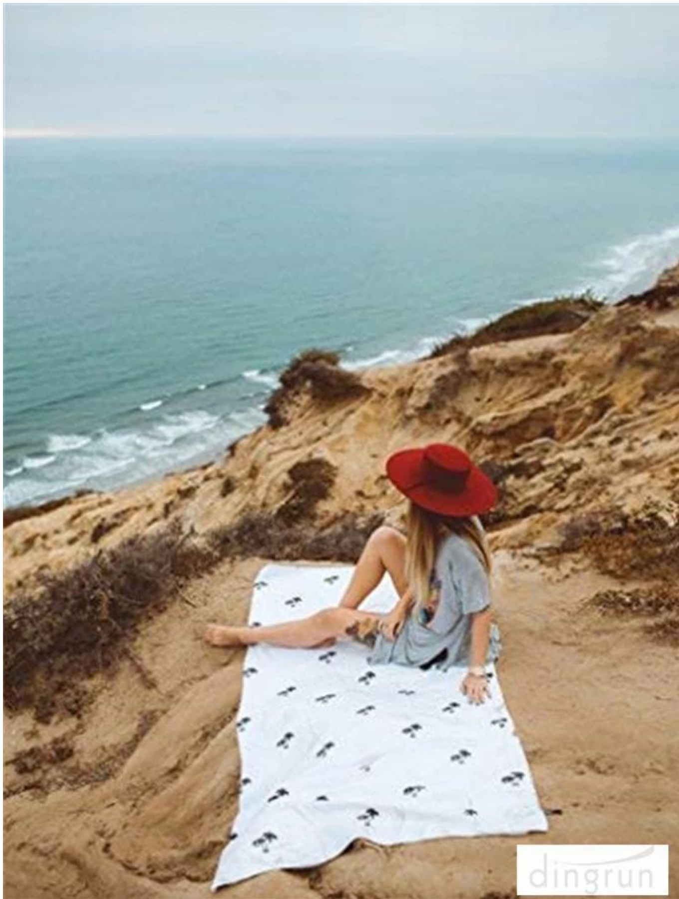
Amistoso para / AS: Playa de viaje, Toalla de playa, Manta de playa, Toallas de baño, Manta de picnic, Camping