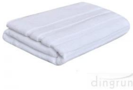
Proveedor de toallas de baño