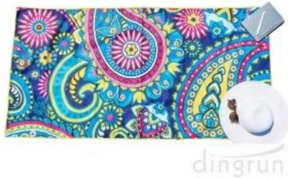
microfibra Fábrica de toallas de