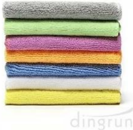
Fabricante de toallas de microfibra playa