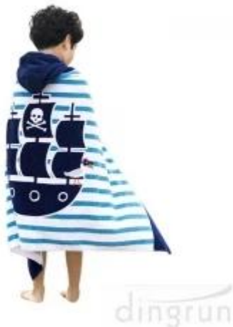
Toalla poncho con capucha