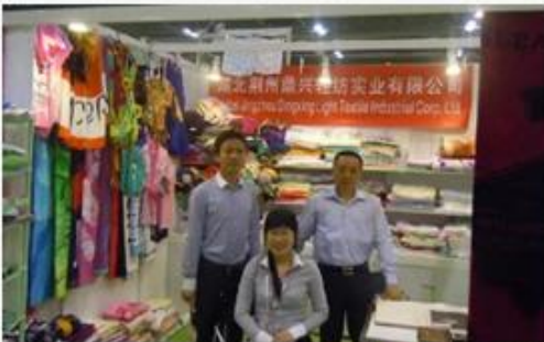
June 19-21, 2013 Miami Houseware Fair, USA