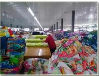
品检 product inspection