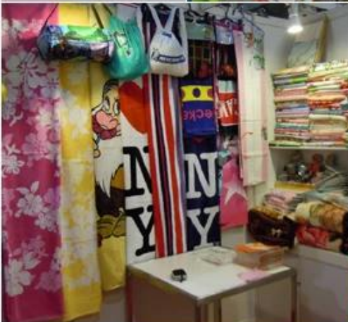
April 19-22, 2011 Hongkong Spring houseware Fair