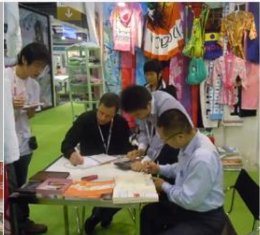
April 19-22, 2011 Hongkong Spring houseware Fair