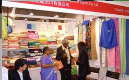
June 19-21, 2012 Miami Houseware Fair, USA