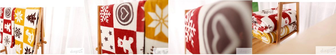
Le maintien de ce polyester flanelle couverture est une tâche facile, car cette couverture de flanelle est lavable en machine.