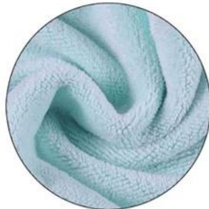
Microfiber Material Soft & Comfortable

Protégez vos cheveux: nous savons tous les deux que les cheveux deviennent fragiles lorsque vous utilisez le sèche-cheveux pendant une longue période. Parce que la chaleur cause des dégâts. Utilisez donc nos serviettes pour les cheveux qui réduisent les frisottis et les fourmis. L'important est que vous ne passiez pas beaucoup de temps sous le sèche-cheveux. Et cela n'a pas la sensation d'une lourde serviette. Il convient à tous les types de cheveux. Comme des cheveux fins, moyens, épais, bouclés, longs et rêches. Protégez vos cheveux: nous savons tous les deux que les cheveux deviennent fragiles lorsque vous utilisez le sèche-cheveux pendant une longue période. Parce que la chaleur cause des dégâts. Utilisez donc nos serviettes pour les cheveux qui réduisent les frisottis et les fourmis. L'important est que vous ne passiez pas beaucoup de temps sous le sèche-cheveux. Et cela n'a pas la sensation d'une lourde serviette. Il convient à tous les types de cheveux. Comme des cheveux fins, moyens, épais, bouclés, longs et rêches