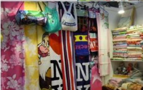
April 19-22, 2011 Hongkong Spring houseware Fair