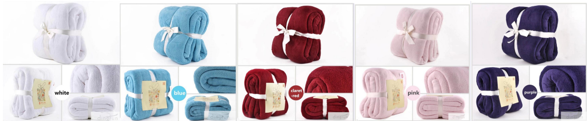
Le maintien de cette chaude couverture molleton est une tâche facile car ce soft couverture molleton est lavable en machine.