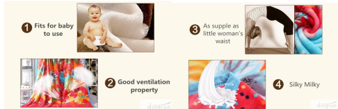
Notre couverture chaude molleton est un excellent choix pour vous de choisir comme gift. Tu peut l'utiliser comme cadeau pour donner à vos parents, vous-même, les clients, les amis, etc.