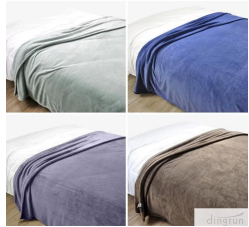
Cette couverture molleton doux est admirablement conçu.