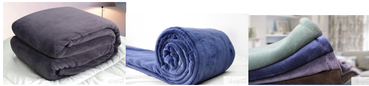
Fabriquée à partir de polyester 100%, la douce couverture molleton est une longue durée de vie, qui à lui 100% polyester rend cette super doux couverture molleton doux et chaud.