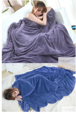
Le super doux couverture molleton vous rendra confortables et à l'aise pendant les nuits fraîches moirde.