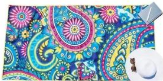
Κατασκευαστής πετσετών μικροϊνών παραλία