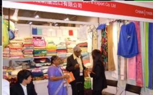
June 19-21, 2012 Miami Houseware Fair, USA