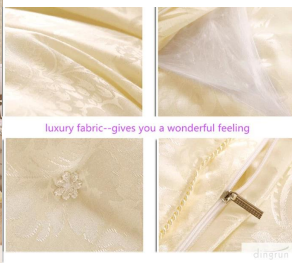
luxury fabric-gives you a wonderful feeling

Μετάξι αντίξοστο φυσικά την υγρασία μακριά από το σώμα το βυθό και εκπαιθεύονται στον αέρα. Υποαλλεργικά και δεν φτάνει που σχετίζονται με αλλεργικές αντιδράσεις. Μεγάλη τηγνή ανθεκτικότητα για την αλλαγή και μερμητομυϊκή πάχυνση. Εξαιρετικά ελαφρύ σαν να κοιμούνται κάτω από ένα σύννεφο. Αντιτάκτες στην βρομιά, μόλυνση, τα σπύρα της ακνών και των ουμών. Φυσικά ανθεκτικά. Κάνοντας την ποιότητα high με πλάκας μετάξι μεγάλα για όλες τις εποχές, βοηθά στην προώθηση της θετικής οικονομικής περιβάλλοντος για χαλαρωτικό των νεύρων, θέρπει το δέρμα και αναζωογονεί το δέρμα.