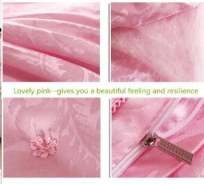
Lovely pink-gives you a beautiful feeling and resilience

Προσφέρουμε την καλύτερη τιμή και είμαστε υπέρθελοι για όλους τους πελάτες μας και την παροχή εξαιρετικής πλάκας. Εμπιστοσύνη ένα από τα μεγαλύτερα εργοστάσια της Κίνας θεσπίζονται σαν εμάς!