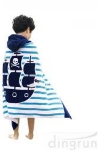
Asciugamano poncho con cappuccio asciugamani da bagno