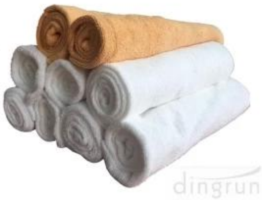
Produttore di asciugamani per la pulizia in microfibra