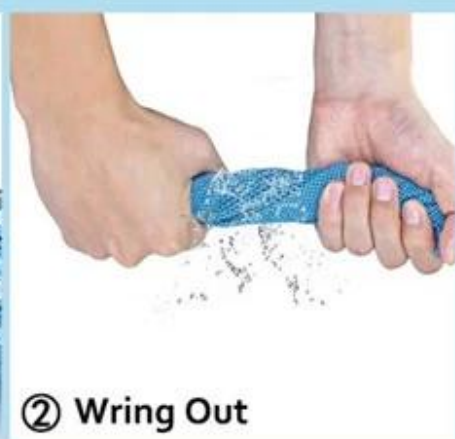
② Wring Out