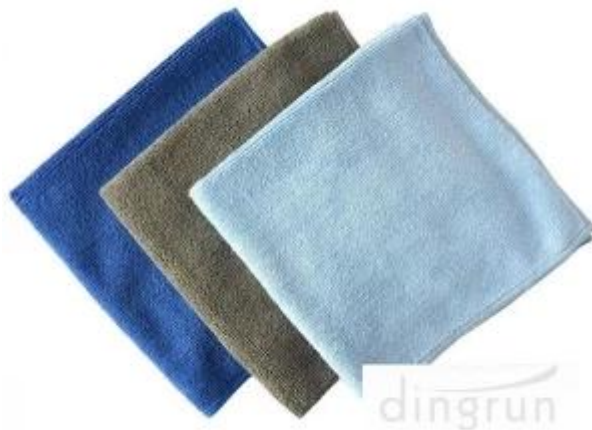
Fornitore di panni per pulizia auto in