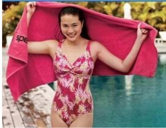
telo mare personalizzato