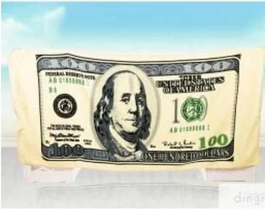
telo mare stampato