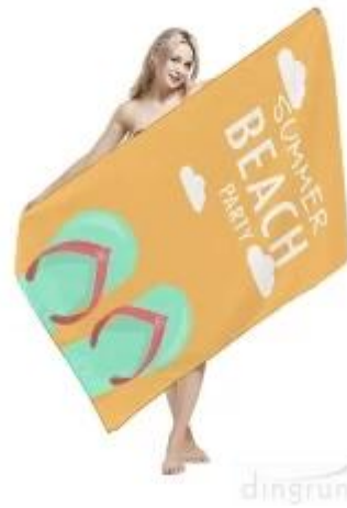
Strandlaken van microvezel

Bent u geïnteresseerd in onze producten, neem dan gerust contact met ons !!