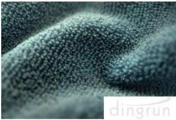
Fabrikant van schoonmaakdoekjes