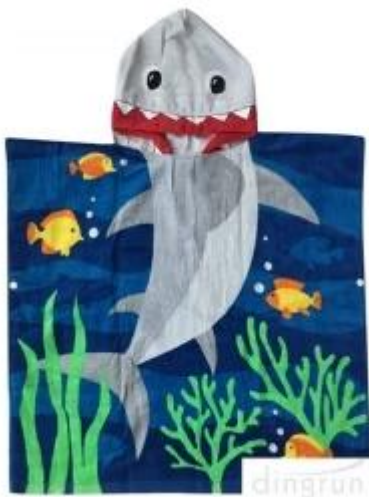
kinderbadjas in groothandel kinderen