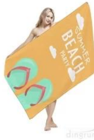
Strandlaken van microvezel

Bent u geïnteresseerd in onze producten, neem dan gerust contact met ons !!