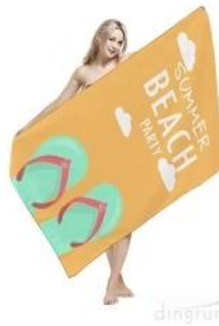
Toalha de praia em microfibra

Se você está interessado em nossos produtos, não hesite em contactar-nos !!