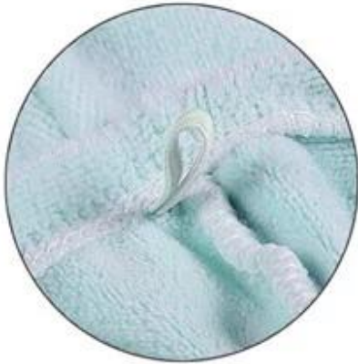
Elastic band, Easy to use