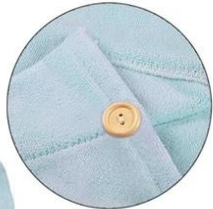
Wooden button. Simple & Strong