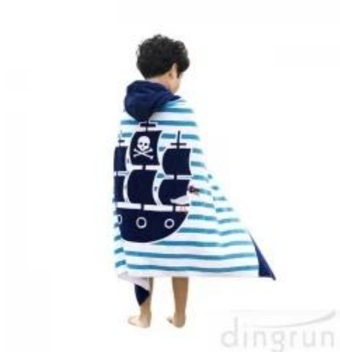
Toalha de poncho com capuz