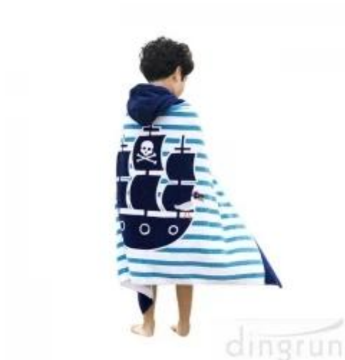
Пончо с капюшоном