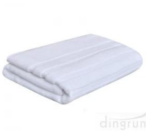
Поставщик полотенец для ванной