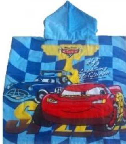
Производители пляжное полотенце с капюшоном пончо