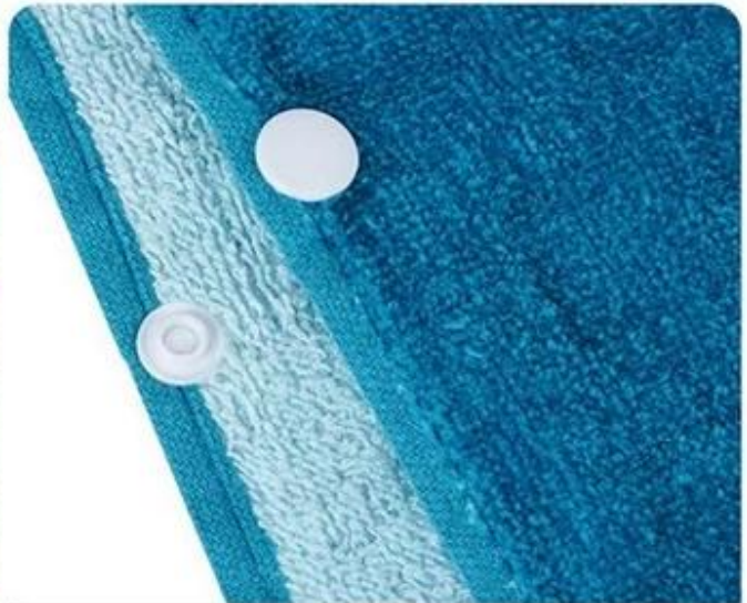
Button Design Prevent towel fall off