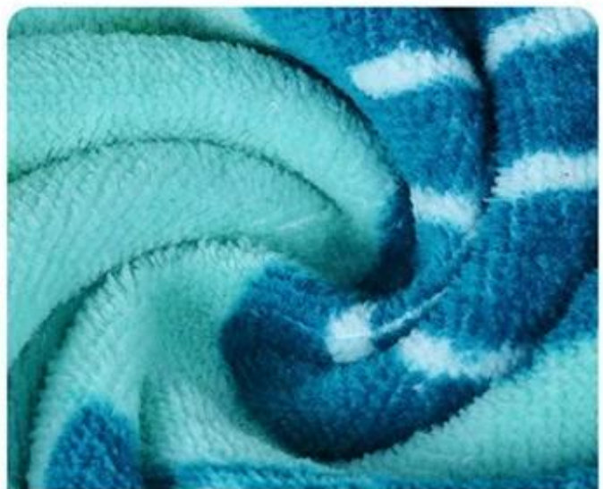
Material Exquisite and smooth

детское пляжное полотенце с капюшоном из 100% 32 пряжи Длинный штапельный махровый хлопок внутри для дополнительной сухости и впитывания и тканый из плотного хлопкового велюра снаружи для мягкого прикосновения и мягкости, который является хорошим банным полотенцем для детей с чувствительной кожей.