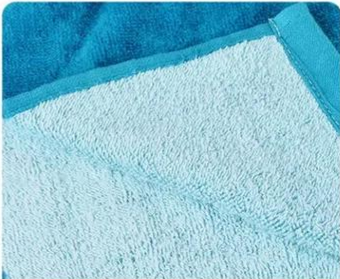
Fabric Cotton Breathable and comfortable