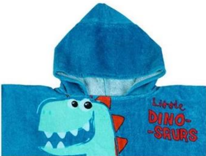
Hood Design Keep kids from getting a cold