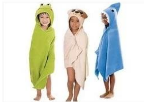
детское полотенце с капюшоном