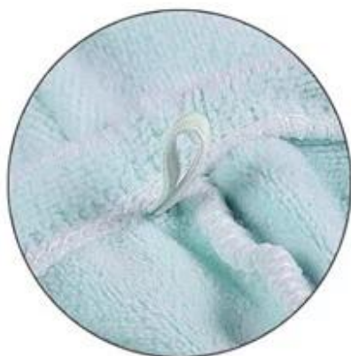
Elastic band, Easy to use