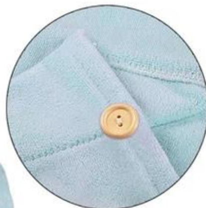
Wooden button. Simple & Strong