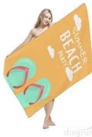
Пляжное полотенце из