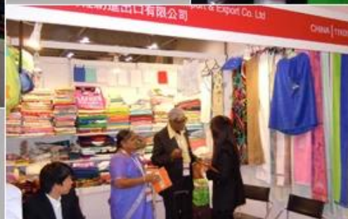
June 19-21, 2012 Miami Houseware Fair, USA